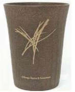
森のタンブラー茅

また、お申込み先着10名様には、 蒜山産茅55%配合の「森のタンブラー茅」 をプレゼントします。